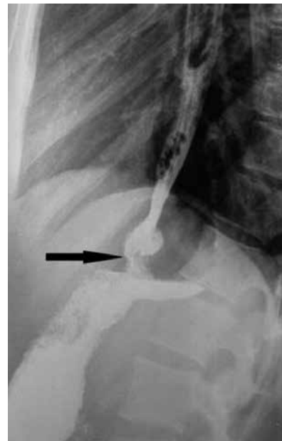
Рис. 2. Ахалазия кардии III стадии. Рентгенограмма через 3 мес после операции. Просвет пищевода не расширен. Стрелкой указаны зона пищеводно-кардиального перехода и зона сформированного инвагинационного клапана