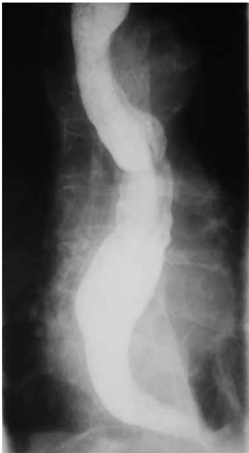
Рис. 1. Ахалазия кардии III стадии. Рентгенограмма до операции: расширение и деформация пищевода Fig. 1. Stage III achalasia cardia. Roentgenogram before surgery: expansion and deformation of the esophagus

18,9 мм рт. ст., имел место гипертонус нижнего пищеводного сфинктера (НПС). Полного расслабления сфинктера при глотании не наступало, что свидетельствовало о наличии диффузного органического эзофагоспазма. С учетом клинко-инструментального обследования был установлен диагноз: «Ахалазия кардии III стадии. Состояние после эндоскопической баллонной пневмокардиодилатации. Диффузный катаральный эзофагит». В плановом порядке пациентке была выполнена реконструктивно-пластическая операция в объеме: демускуляризация абдоминального отдела пищевода с селективной проксимальной ваготомией и формированием инвагинационного клапана по методике Г.К. Жерлова [13]. В результате оперативного вмешательства была восстановлена свободная проходимость пищевода, регургитация прекратилась. На рис. 1–4 отражена динамика результатов исследования до и после операции: на рис. 1, 2 – данные рентгенологического исследования, на рис. 3, 4 – данные эндоскопической ультрасонографии.