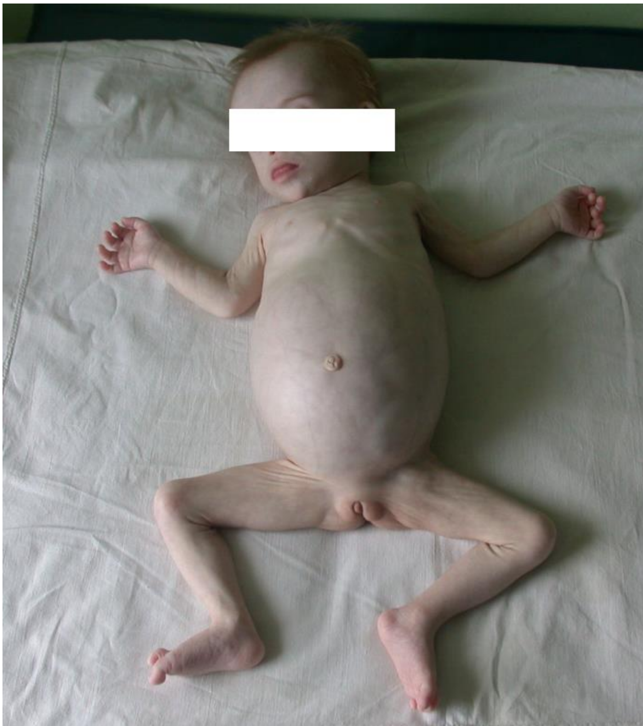
Рис. 3. Внешний вид больной, страдающей гипотрофией III степени

воте; при гипотрофии II степени подкожный жировой слой исчезает на животе, груди, резко истончен на конечностях (рис. 3); при гипотрофии III степени отмечают полное отсутствие подкожно-жирового слоя. Вследствие отсутствия жировых комочков Биша лицо ребенка приобретает треугольную форму, становится морщинистым («лицо Вольтера»).