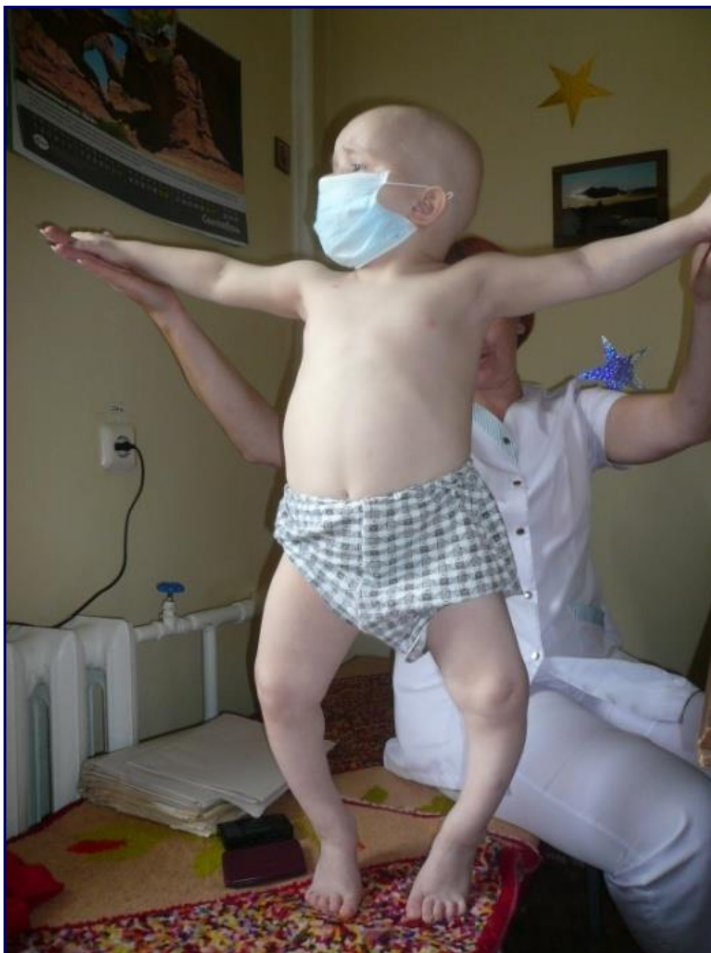
Рис. 4. Варусная деформация нижних конечностей

В тяжелых случаях нарушается функциональное состояние печени и желудочно-кишечного тракта, белковый и липидный обмен, имеет место проявление дефицита витаминов А, Е, С, В 5 , В 6 , В 12 , меди, цинка, магния. Гипотония мышц, деформация грудной клетки, более слабые движения диафрагмы и изменения нервной системы ухудшают легочную вентиляцию, в результате чего возникает предрасположенность к воспалению легких, также присутствуют дистрофические изменения сердца.