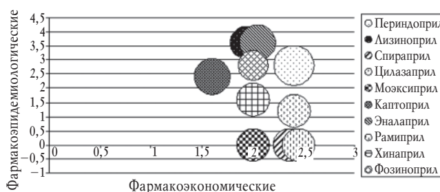
Рис. 2. Карта восприятия МНН ЛП по группе ингибиторов АПФ

Карта восприятия представляет собой матрицу с двумя осями, на которых отражаются значения координат по фармакоэкономическим и фармакоэпидемиологическим параметрам, а размер круга определяется значением нормативных параметров (рис. 2).